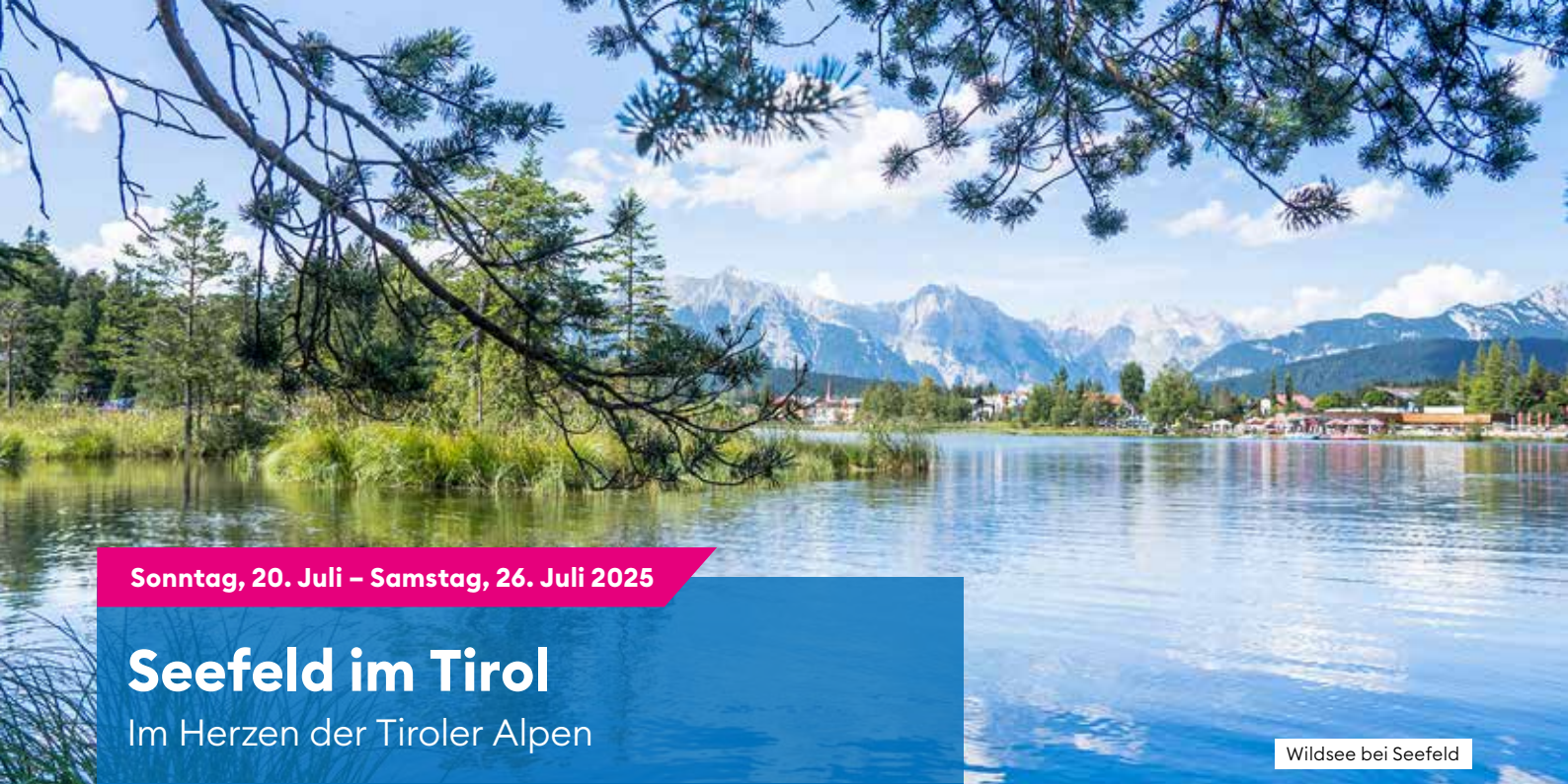
Wildsee bei Seefeld

Sonntag, 20. Juli – Samstag, 26. Juli 2025